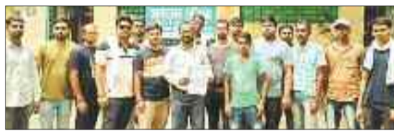
प्रदर्शन करते हड़ताली कर्मी।