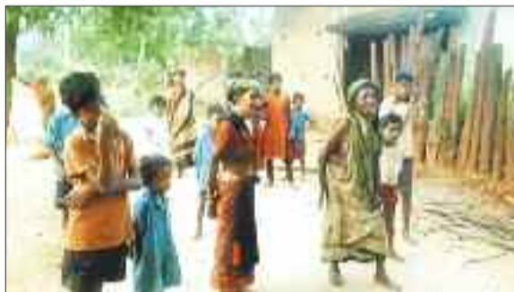
पहाड़ी कोरवा परिवार के सदस्य।

डिविजन और मेमर्स जेबीएस कंपनी उनकी मांगों को नजरअंदाज कर रहा है। 7 माह से पीएफ 4 माह से ईएसआईसी का भुगतान रोक रखा है जिससे कर्मचारियों को पीएफ क्लेम नहीं हो पा रहा है तो ईएसआईसी से मेडिकल सुविधाये मिलना बंद हो गया है। बोनस भुगतान सब स्टेशन स्ट्रेन्सरी का सामान और श्रम विभाग कुशल दर पर भुगतान से संबंधित शिकायत पूर्व में 4 मई को उच्च अधिकारियों को समस्यओं से अवगत कराया गया था लेकिन अभी तक समस्या का समाधान नहीं किया गया है। जिस कारण 132 केवी कोरबा, दर्रा,चाम्पा व हुरीखुर्द के चार सबस्टेशन के सभी कर्मचारी 7 दिवसीय हड़ताल चले गए हैं।