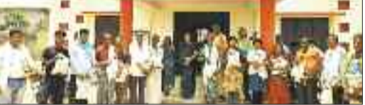
धनरास में बीज का किया गया वितरण