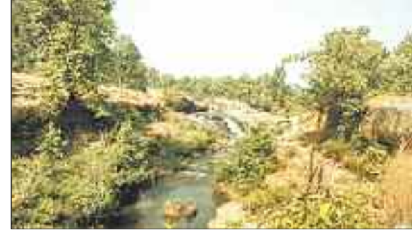
परसाखोला स्थित नाला।