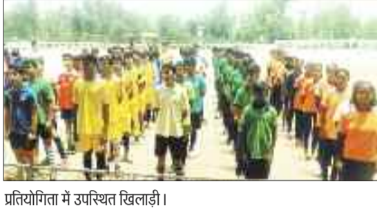
प्रतियोगिता में उपस्थित खिलाड़ी।

जिले के सरकारी स्कूलों की स्थिति खेल में भी संतोषजनक नहीं है। स्कूलों में खेल शिक्षक की पदस्थापना होने के बावजूद भी फुटबाल जैसे खेल के लिए बीते पांच साल से किसी भी सरकारी स्कूल से फुटबाल की टीम सामने नहीं आ रही है। शालेय खेल कैलेंडर के तहत गुरुवार को आयोजित हुई सुब्रतो कप फुटबाल प्रतियोगिता में केवल निजी स्कूल की टीम ही भाग ले सकी।