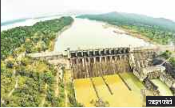
हरिभूमि न्यूज || कोरबा

बारिश का सीजन शुरू होते ही किसानों का काम जोर पकड़ने लगा है और किसानों के चेहरे पर मुस्कान भी आने लगी है तो वहीं दूसरी ओर बांगो डेम के कैचमेंट इलाके में भी बारिश का असर