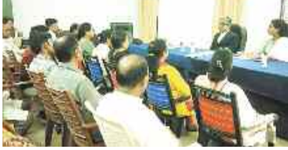
प्रशिक्षण में उपस्थित पैरालीगल वॉलिटियर्स।